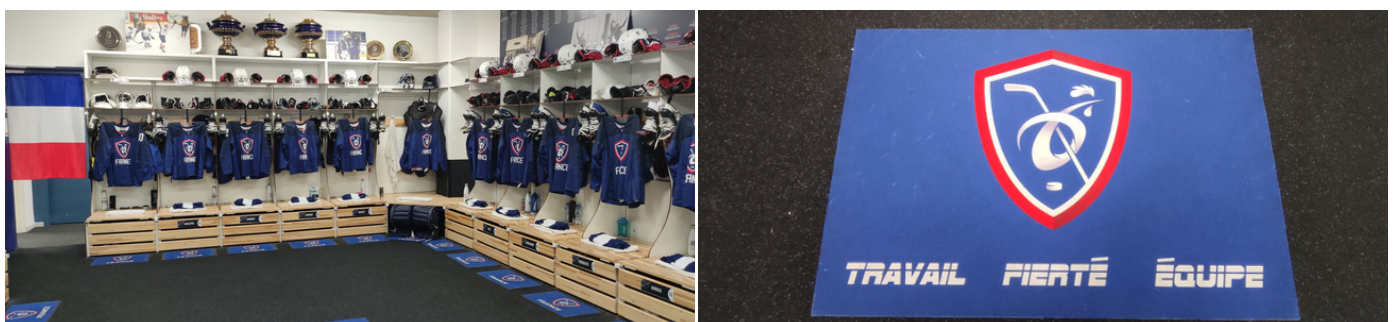
Le vestiaire, prêt avant la dernière bataille