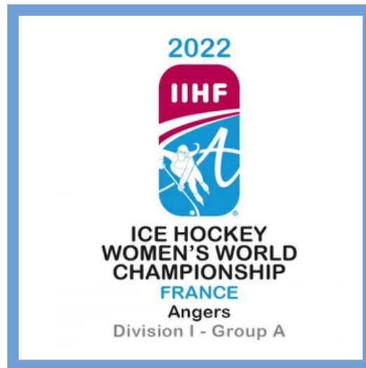
Le logo de la compétition

Inauguré le 13 septembre 2019 dans l'optique des Mondiaux D1A, l' IceParc d'Angers est une patinoire moderne au sein de laquelle Ducs évoluent en Ligue Magnus tout au long de la saison. Elle dispose d'une capacité de plus de 3500 places pour les rencontres de hockey sur glace.