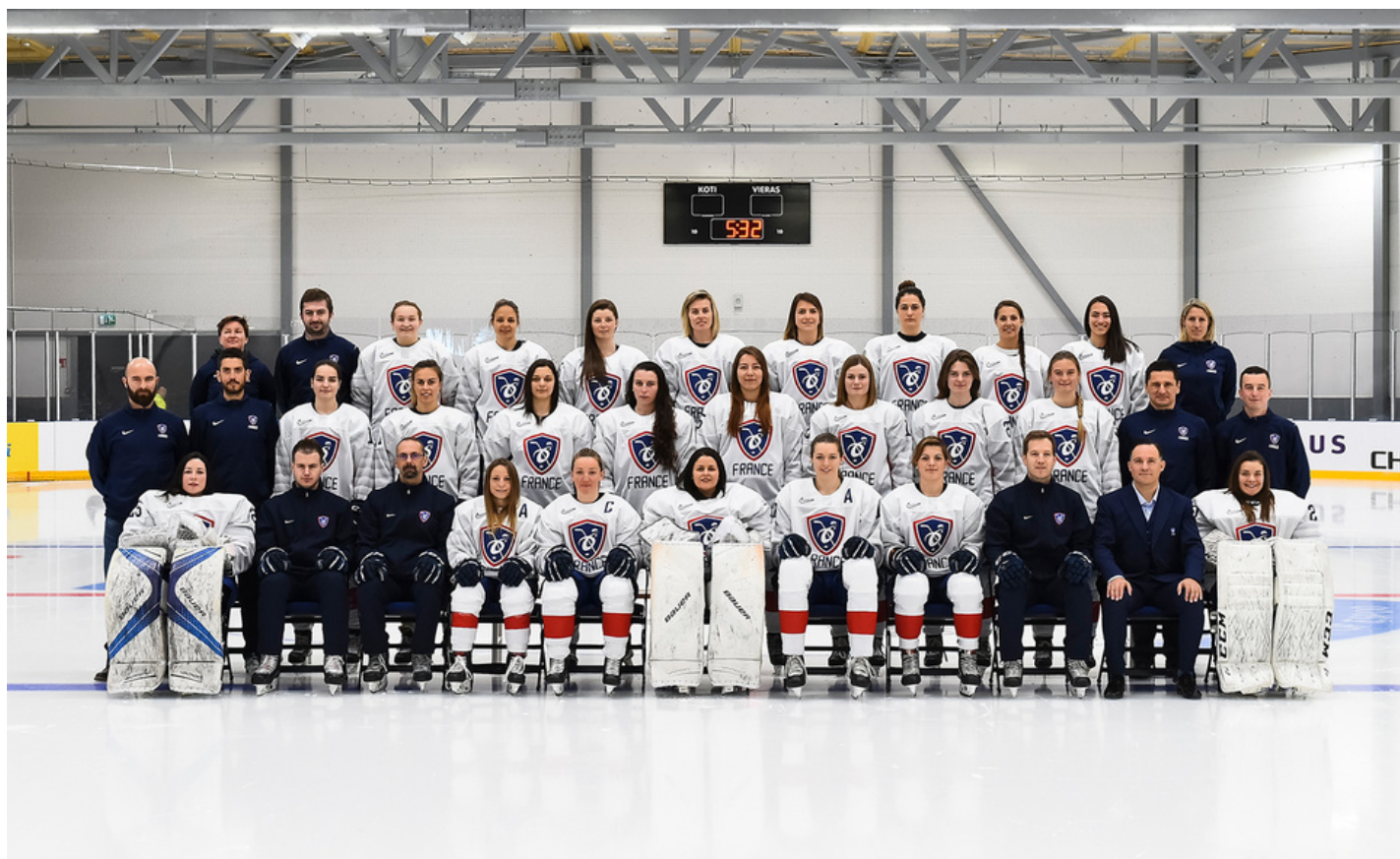
Photo d'équipe officielle