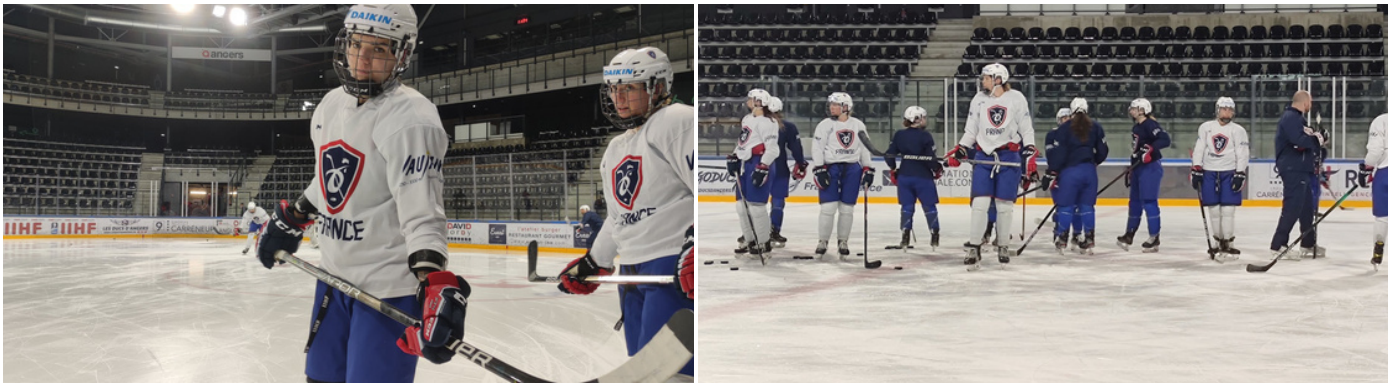
Le dernier morning skate avant France-Norvège

Au bout d'une semaine de compétition à Angers, le Mondial D1A rendait enfin son verdict. L'équation était simple, que ce soit pour l'Équipe de France comme la Norvège : l'emporter à tout prix pour décrocher la médaille d'or. Cela allait ainsi mettre quoi qu'il arrive un terme à une semaine inoubliable dans le Maine-et-Loire. De quoi conserver quelques souvenirs.